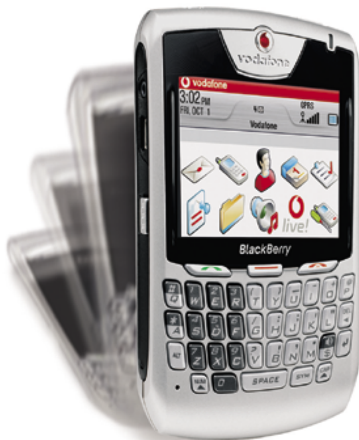
3G BlackBerry 8707™

Τώρα έχετε όλα όσα χρειάζεστε σε μία μόνο συσκευή